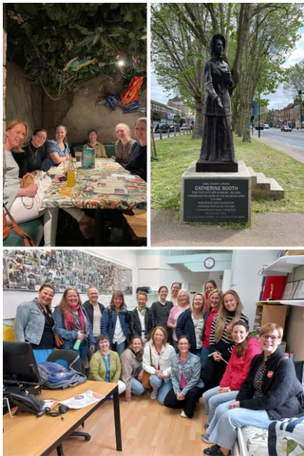
(Studietur til London i juni)

I 2023 har koordinator deltatt på ulike arrangementer i regi av HSFN og Frelsesarmeen. Koordinator har blitt utdannet COS-P veileder i mars, deltatt på studietur til London i juni, HSFNs koordinatorsamling i september, Frelsesarmeens barnevernkonferanse og markert at Home-Start er 50 år globalt.